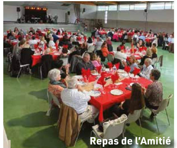
Repas de l'Amitié