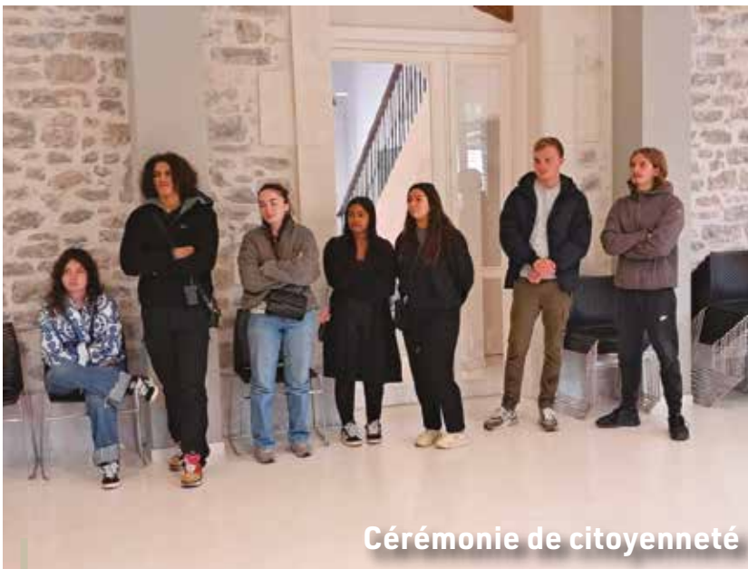
Cérémonie de citoyenneté

Succès fou pour cette première édition de la descente historique ! Ce sont 17 engins contrôlés avec soin, conçus avec beaucoup d'imagination qui ont ravi les centaines de spectateurs qui ce sont massés tout au long du parcours. Espérons que la seconde édition sera aussi exceptionnelle !