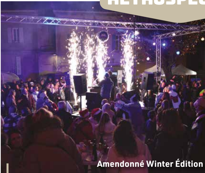
Amendonné Winter Édition

Une soirée givrée mais une piste de danse enflammée à l'Amendonné Winter Edition de Ceyreste ! Le vendredi 13 décembre, l'ambiance était au rendez-vous pour notre traditionnelle soirée Amendonné avec : plusieurs DJ, différents stands créatifs, mais surtout le feu d'artifice tiré depuis la Place Albert Blanc. Rendez-vous en juillet pour la Summer Edition !